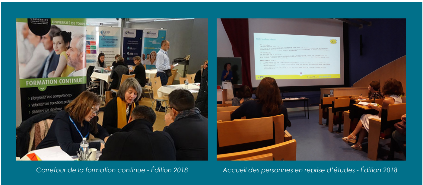
Carrefour de la formation continue - Édition 2018